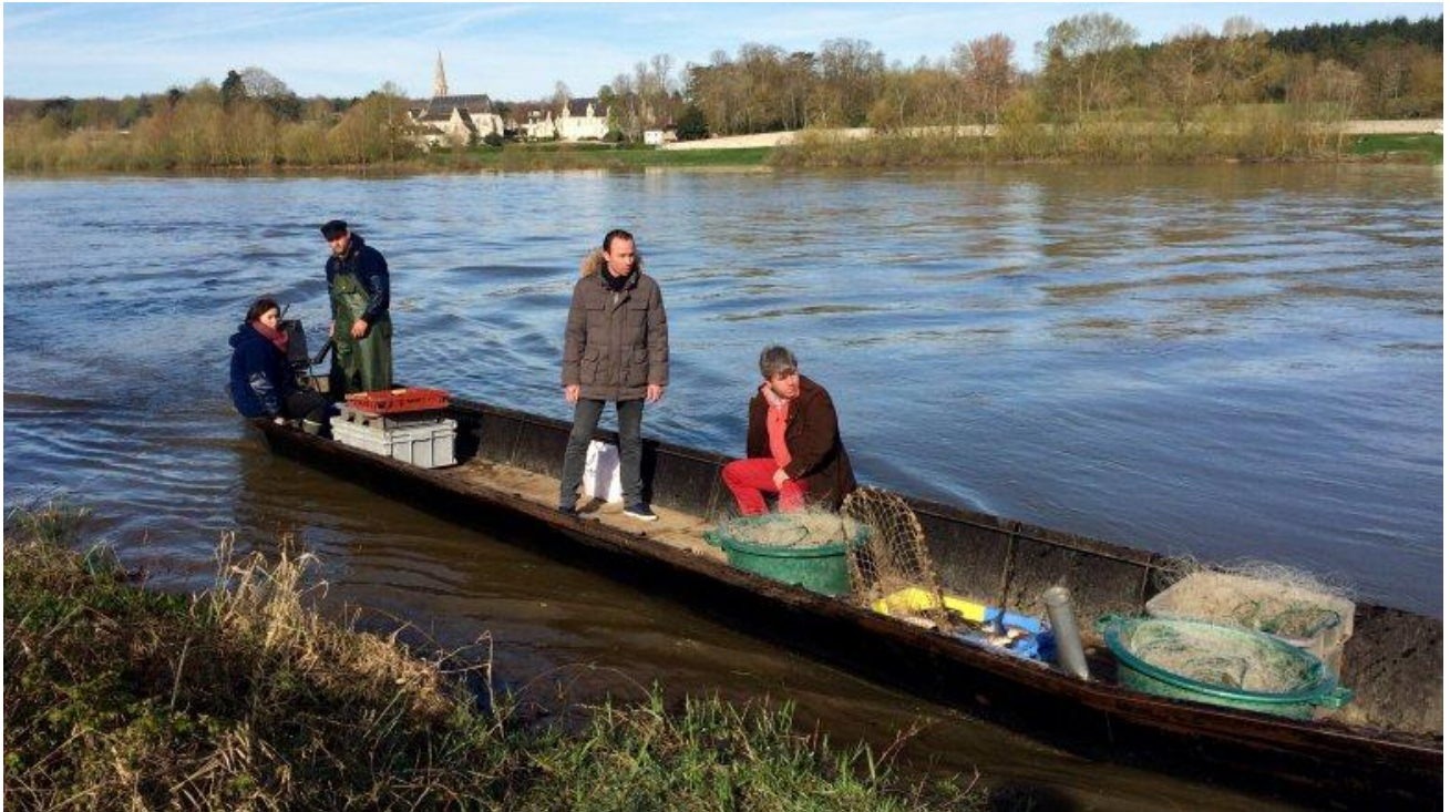
Retour de pêche