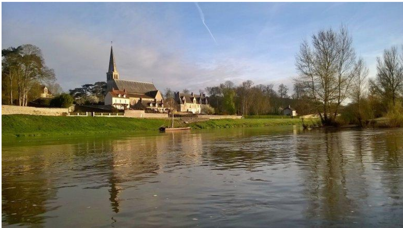
Des paysages à admirer