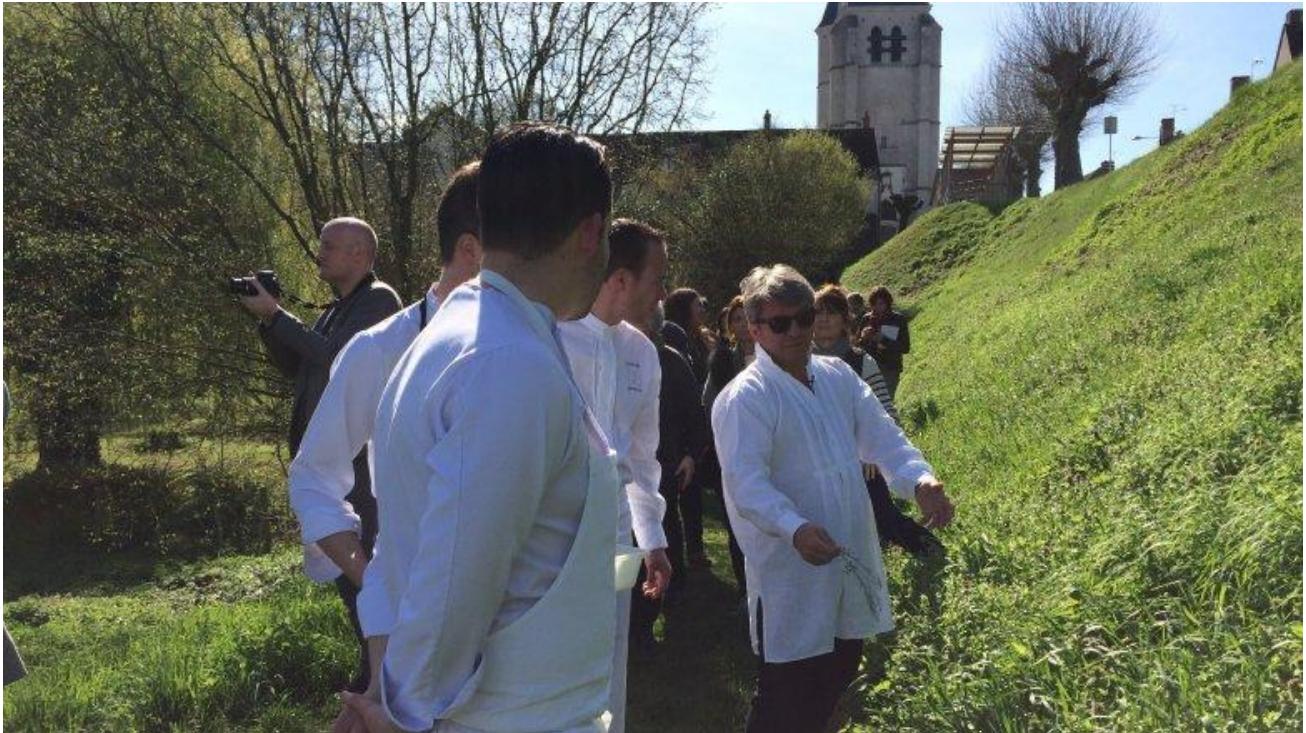
Des herbes pour aromatiser