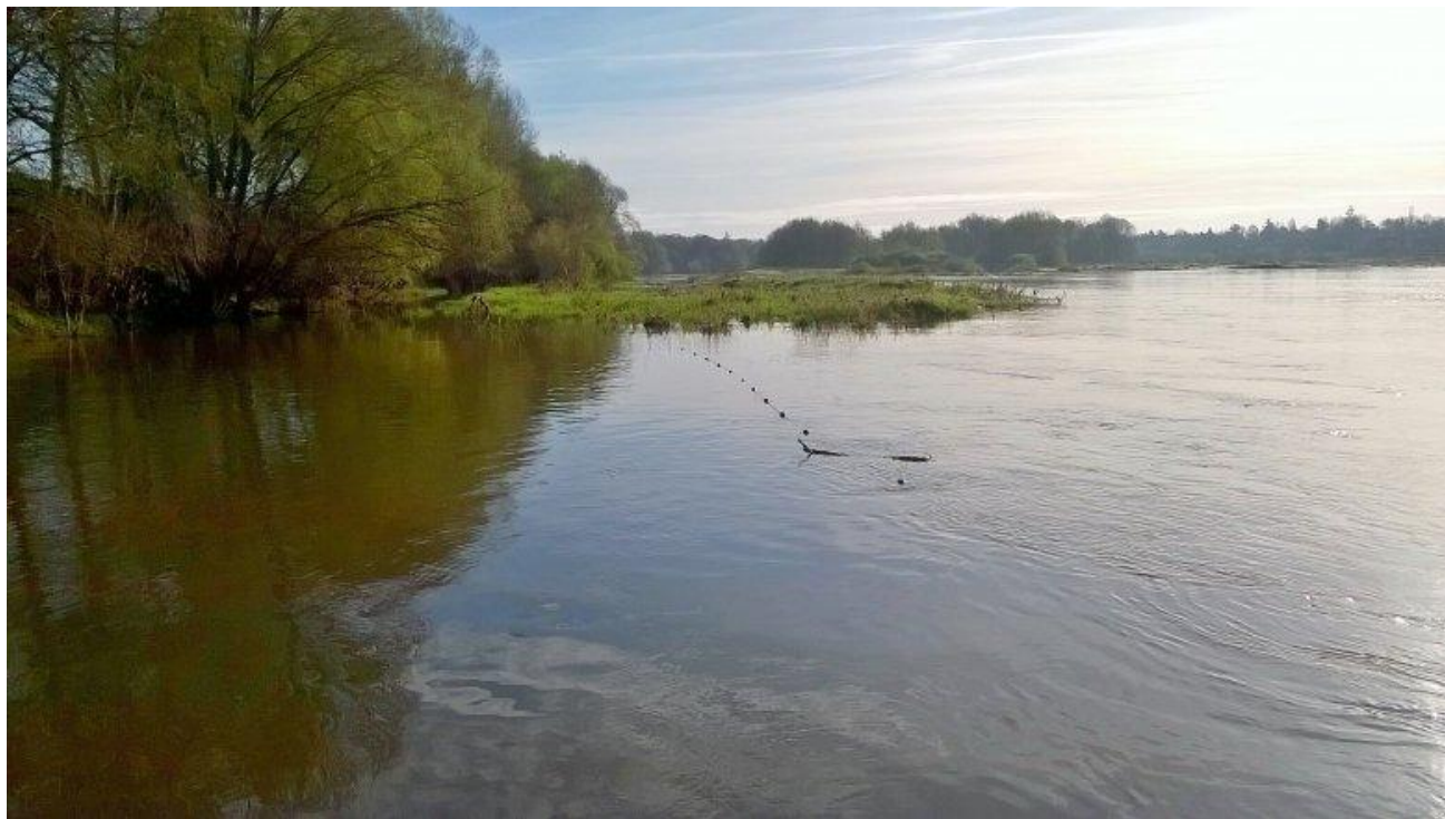
Des filets à relever