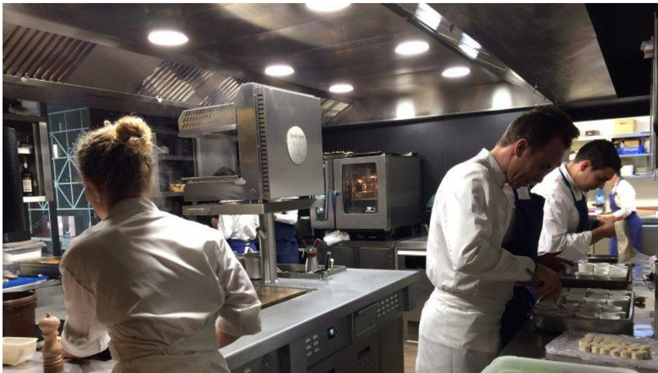
Un repas à préparer...