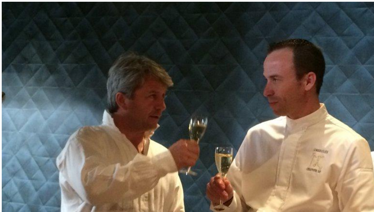
Un verre pour célébrer ;-)