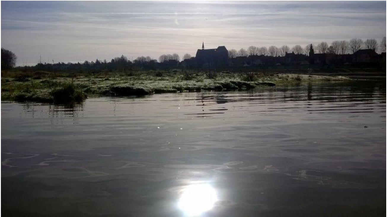
Paysage de Loire