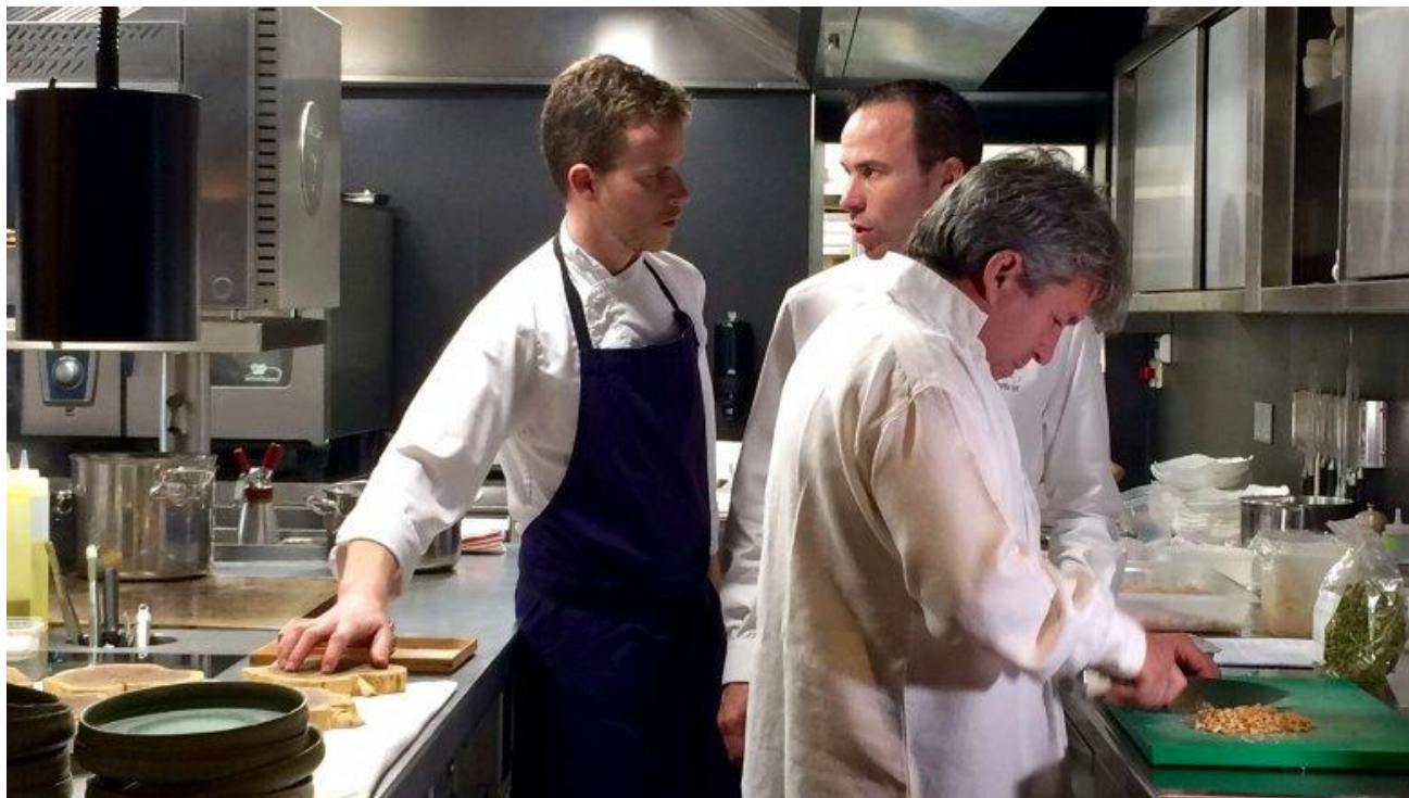
Des talents à associer...