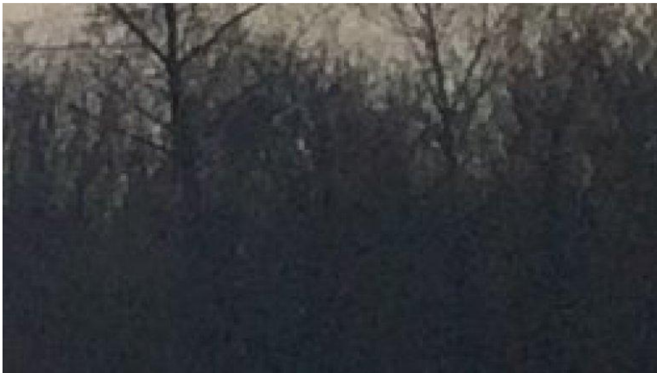
Lever de soleil sur la Loire avec Sylvain, pêcheur de Loire